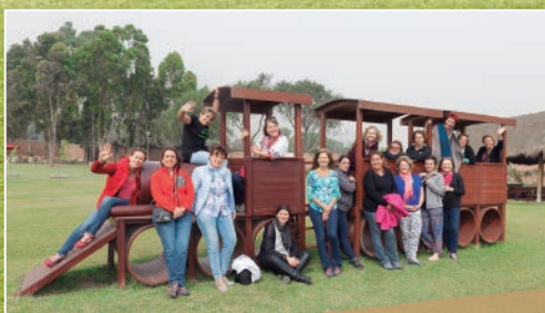
Áreas infantiles y familiares