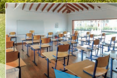
Salones para capacitaciones