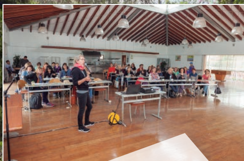
Gran salón multiusos